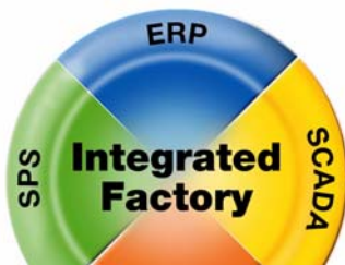
Einbettung von Manufacturing Execution Systems in das Konzept der Integrated Factory

Produktionsmanagementsysteme - im Fachvokabular Manufacturing Execution Systems (MES) - erlauben die Aufzeichnung, Überwachung und Kontrolle von Prozessen in Echtzeit sowie die eindeutige DV-gestützte Zuordnung von Qualitätsdokumenten zum Produkt selbst.